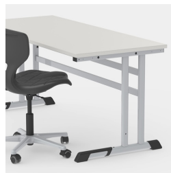
Durch C-Form kein Stören der Tischbeine beim Ein- und Aussteigen