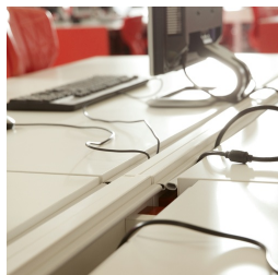
Platte auf Gleitbeschlag verschiebbar für verdeckte Kabelführung, abgedichtet mit Gummilippe