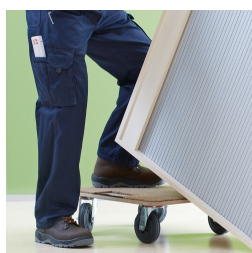
Korpus ab Werk fest verdübelt und verleimt für schnellen Aufbau vor Ort