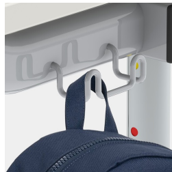
Inklusive einem Doppel-Mappenhaken pro Sitzplatz