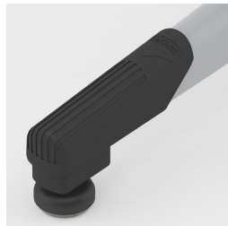
Bodenschoner mit integriertem Trittschutz und Neiveauausgleich