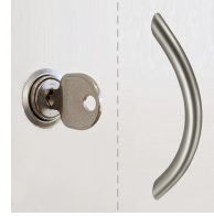
Standardmäßig mit Schloss und Griff, 1 OH mit Schloss oder Griff