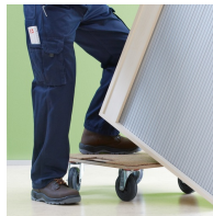
Korpus ab Werk fest verdübelt und verleimt für schnellen Aufbau vor Ort