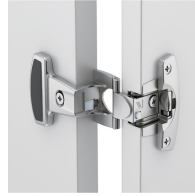
Metall-Topfscharnierbänder mit 240° Öffnungswinkel