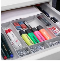
Utensilienauszug für Büromaterialien