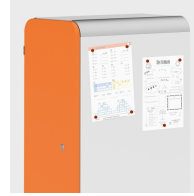
Optional mit magnethaftenden Seiten