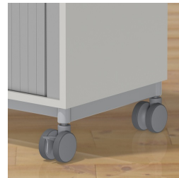
Rollladenschrank optional fahrbar mit Rollen