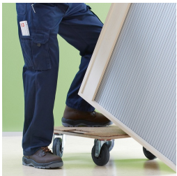
Korpus ab Werk fest verdübelt und verleimt für schnellen Aufbau vor Ort