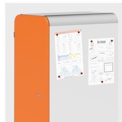
Optional mit magnethaftenden Seiten