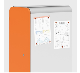
Optional mit magnethaftenden Seiten