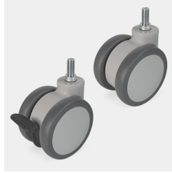
Fahrbar auf 4 Rollen davon 2 feststellbar