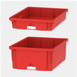
Tidy Boxen zur Aufbewahrung