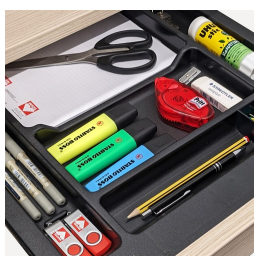
Utensilienauszug für Büromaterialien