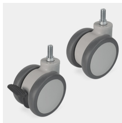
Fahrbar auf 4 Rollen davon 2 feststellbar