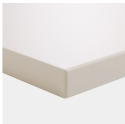
Plattenmaterial melaminharzbeschichtet mit robuster Kunststoffkante