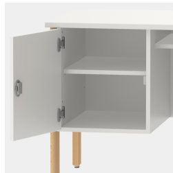
Unterschrank inkl. einem Fachboden, mittels Sicherheitsschloss abschließbar