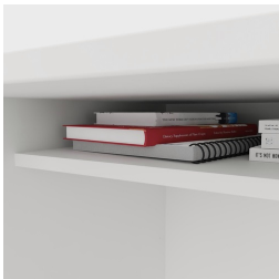
Inklusive praktischer Ablage