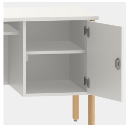
Unterschrank inkl. einem Fachboden, mittels Sicherheitsschloss abschließbar