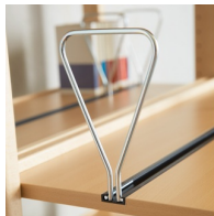
Optional Buchstützen in Nutschienen