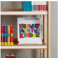
Böden mit Beschriftungsleiste