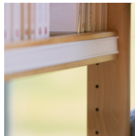
Einfache Verstellung der Böden durch Lochreihe