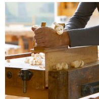
Massives Buchenholz aus nachhaltiger Forstwirtschaft