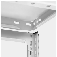
Stecksystem ohne Schrauben