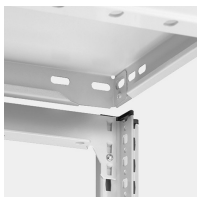
Stecksystem ohne Schrauben