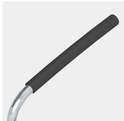
Inklusive Armlehne mit schwarzem Softgrip-Überzug