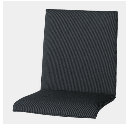
Körpergerecht geformte Sitzschale mit Vollpolster