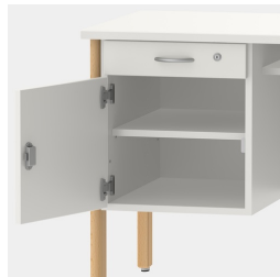
Unterschrank inkl. Schublade, mittels Sicherheitsschloss abschließbar