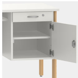
Unterschrank inkl. Schublade, mittels Sicherheitsschloss abschließbar