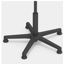
Absolut robustes Kunststoff-Fußkreuz in schwarz