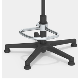
Optional mit Teilfußring