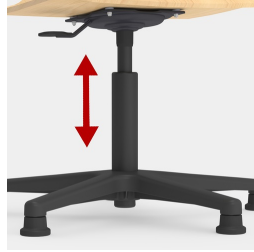
Höhenverstellung durch Sicherheitsgasfeder