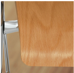
Sitzschale umweltfreundlich lackiert mit Lack auf Wasserbasis