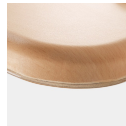
Optional WOODMARK Tischplatte in bruchfester Qualität