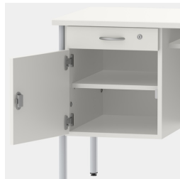
Unterschrank inkl. Schublade, mittels Sicherheitsschloss abschließbar