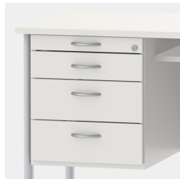
Unterschrank inkl. Utensilienauszug und Schubladen mit Einzugsdämpfung und Zentralverschluss