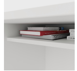
Inklusive praktischer Ablage