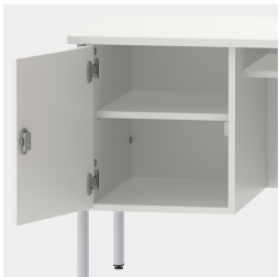
Unterschrank, inkl. einem Fachboden, mittels Sicherheitschloss abschließbar