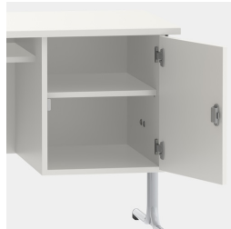
Unterschrank, inkl. einem Fachboden, mittels Sicherheitsschloss abschließbar