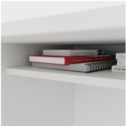
Inklusive praktischer Ablage