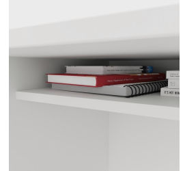
Inklusive praktischer Ablage