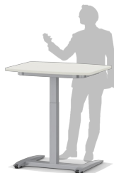
Auch als mobils Rednerpult einsetzbar