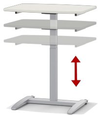
Stufenlos höhenverstellbar im Bereich von 70-110 cm