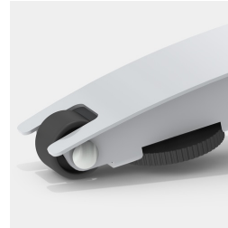
Druch 2 Rollen an der Fuß-Hinterkante fahrbar, bei leichter Neigung