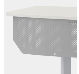
Optional Frontblende aus Lochblech