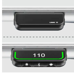
Handschalter mit Auf- und Ab- Funktion oder optional mit Memoryfunktion