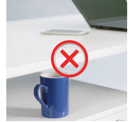
Kollisionsschutz minimiert das Risiko von Schäden beim Auf- und Abfahren