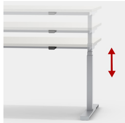
Stufenlos und leise höhenverstellbar im Bereich von 62-127 cm