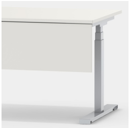
Passendes Zubehör: Frontblende Modell 2050.182