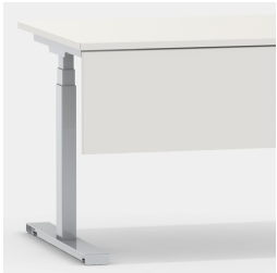
Passendes Zubehör: Frontblende Modell 2050.202