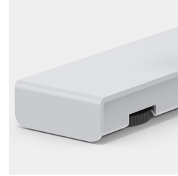
Bodenschoner mit Niveauegleich zum einfachen Ausgleichen von Bodenunebenheiten