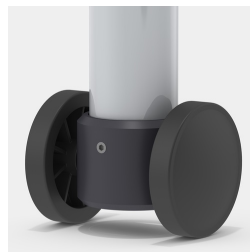
Optional Gestell fahrbar mittels 2 Bockrollen