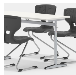
Durch Mittelsäulengestell beidseitig bestuhlbar