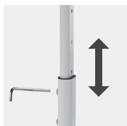
Mittels Arretierung in der Höhe verstellbar