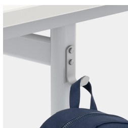
Inklusive einem Mappenhaken pro Sitzplatz