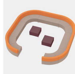
Mit geraden DOMINO Sitzelementen individuell erweiterbar