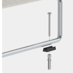
Optional mit geschraubter oder geklebter Bodenbefestigung