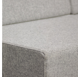
Langlebige Qualität durch hochwertige Verarbeitung