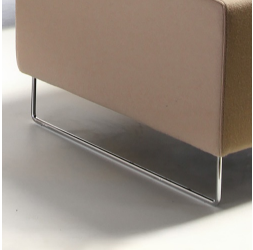
Stabiles Gleitkufenstell optional verchromt