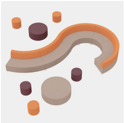
Mit den Serien CYLINDRA und BLOC kombinierbar