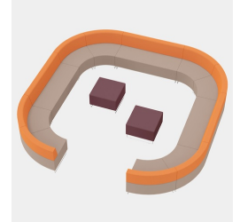
Mit geraden DOMINO Sitzelementen individuell erweiterbar