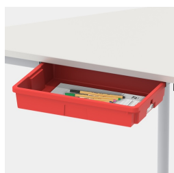
Inklusive ein Paar Schienen für optionale Tidy Box