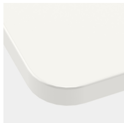
Tischplatte mit 40 mm Eckradius