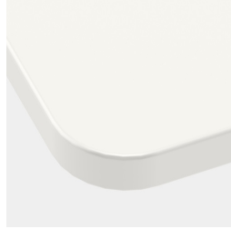
Tischplatte mit 40 mm Eckradius