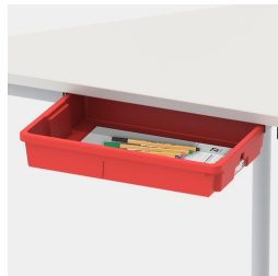
Inklusive ein Paar Schienen für optionale Tidy Box