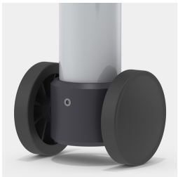
Optional Gestell fahrbar mittels 1 Bockrolle