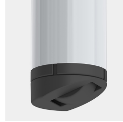
Optional Gestell fahrbar mittels 2 Rollen