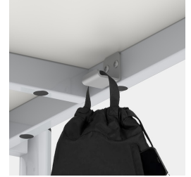
Optional mit einem Mappenhaken je Sitzplatz