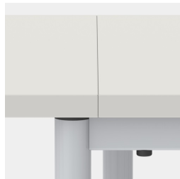
Tischplatten fugenlos aneinander stellbar