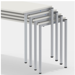
Durch besondere Gestellkonstruktion bis zu 4 Tische stapelbar