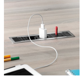
Optional je zwei Steckdosen mit USB Port oder Netzwerkanschluss: 1x mittig, 1x links, 1x rechts oder beidseitig