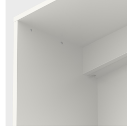
Mit integriertem Kabelkanal, hinten