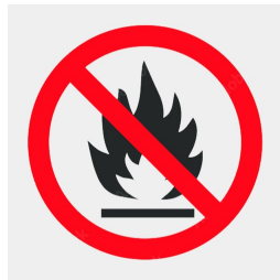
Trägerplattenmaterial schwer entflammbar nach DIN 4102 B1