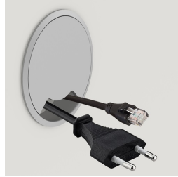
Optional mit seitlichem Kabeldurchlass