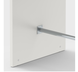
Inklusive Fußstütze zum bequemen ablegen der Füße