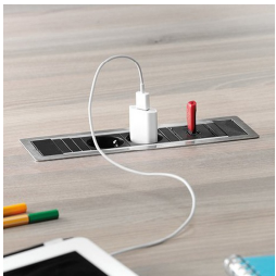
Optional je zwei Stockdosen mit USB Port oder Netzwerkanschluss: links und rechts