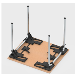
Einfaches Einklappen der Tischbeine