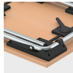
Stapelschoner schützen die Tischplatte vor Kratzspuren