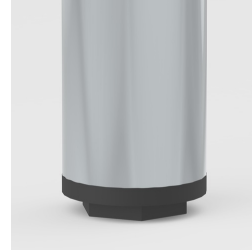
Bodenschoner mit Niveauegleich: gleicht Bodenebenheiten aus