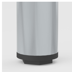
Bodenschoner mit Niveauegleich: gleicht Bodenunebenheiten aus