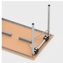
Einfaches Einklappen der Tischbeine