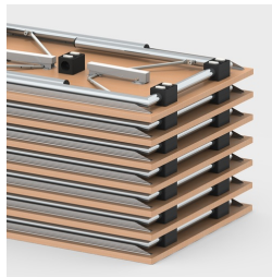
Bis zu 16 Tische stapelbar