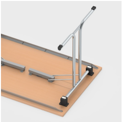
Einfaches Einklappen der Tischbeine