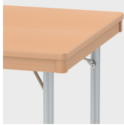
Optional mit zurückgesetzter Massivholzzarge