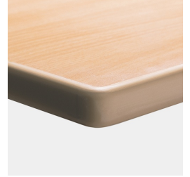
Optional Tischplatte melaminharzbeschichtet mit ASSODUR®-Kante