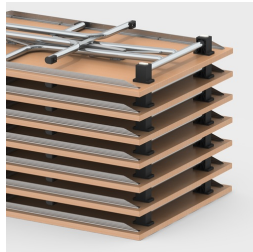
Bis zu 16 Tische stapelbar